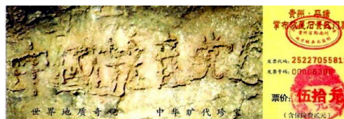
掌布风景区门票上“中国共产党亡”的照片

倘若“亡共石”确是天意，这么大的事要发生，被世人称为“太行第一奇观”的猪叫石这几年能不狂叫吗？其实大家多少都有感应。人们当前的热门话题，议论最多的是贪官、人心败坏和退党大潮（至二零零七年八月，上网声明退出党团队的已有二千四百九十万人）。党之将亡，怪异丛生，石头异象警示世人逃脱陪葬厄运，赶快退党保命。