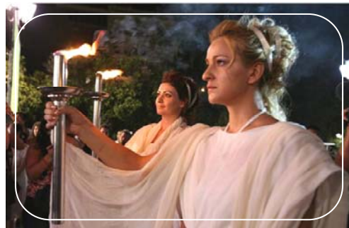
人权圣火在希腊雅典被点燃

【明慧网】2007年8月9日晚，在奥林匹克的发源地希腊首都雅典市中心宪法广场上，来自欧美亚澳四大洲的各界代表和支持者，点燃了人权圣火，并开启了在全球为期一年的传递旅程，呼吁国际社会，拒绝让象征人类和平自由的奥运，变成中共实行独裁和镇压的“血腥奥运”。