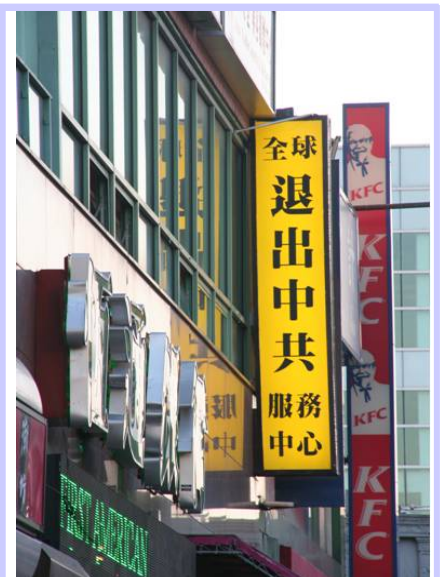
图为“全球退出中共服务中心”的灯箱标识牌。位于美国纽约第二大唐人街法拉盛最热闹的市区。

▲美国新泽西州南平原市劳动节游行于 9 月 3 日举行。法轮功作为近百个团体中唯一的亚裔队伍参加了这一州内规模最大的劳动节游行。其中天国乐团以其整齐优异的精神风貌、平和纯善的演奏获得了本次游行评委会的总体最佳奖。◇