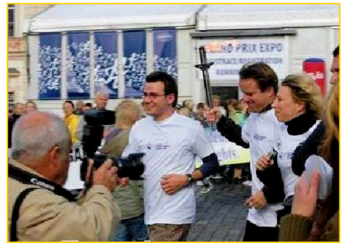
▲捷克副总理（右二）传圣火

由“法轮功受迫害真相联合调查团”发起的以提醒各国民众关注中国人权为目的的“奥运人权圣火接力活动”经由柏林和