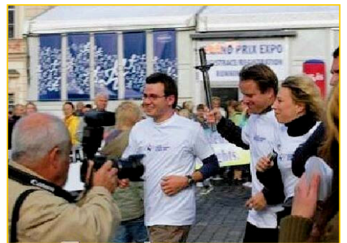
▲捷克副总理（右二）传圣火

由“法轮功受迫害真相联合调查团”发起的以提醒各国民众关注中国人权为目的的“奥运人权圣火接力活动”经由柏林和