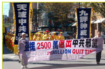
温哥华声援 2500 万人退党

大纪元时报于 2004 年 11 月推出系列社评《九评共产党》以来，很快就在大陆引发了“退党、退团、退队，简称“三退”）的大潮。“全球退党服务中心”应运而生。目前在全球五大洲 30 多个国家和地区设立了共达 100 多个服务点，数以万计的志愿者正日夜义务服务。