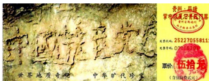
掌布风景区门票上“中国共产党亡”的照片

倘若“亡共石”确是天意，这么大的事要发生，被世人称为“太行第一奇观”的猪叫石这几年能不狂叫吗？其实大家多少都有感应。人们当前的热门话题，议论最多的是贪官、人心败坏和退党大潮（至二零零七年九月，上网声明退出党团队的已有二千六百多万人）。党之将亡，怪异丛生，石头异象警示世人逃脱陪葬厄运，赶快退党保命。◇