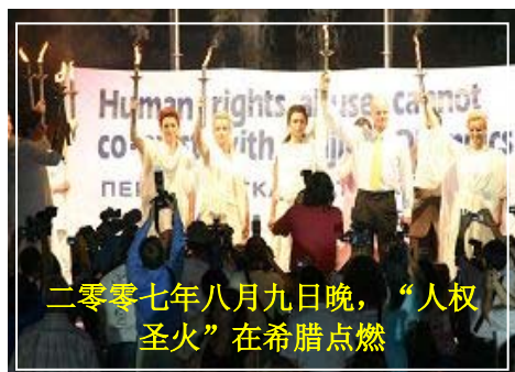
二零零七年八月九日晚，“人权圣火”在希腊点燃

人权圣火点火仪式上，来自各大洲的代表纷纷发言，谴责中共对信仰的迫害和对人权的践踏。