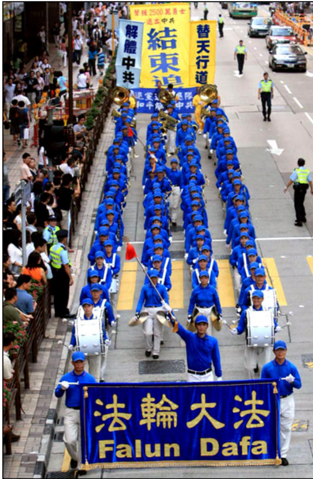
替天行道，解体中共，结束迫害