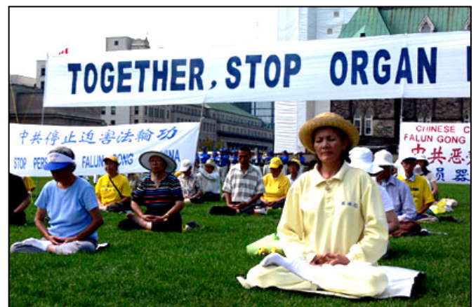
法轮功学员在国会山前集会，呼吁总理帮助制止迫害

【明慧网】零七年八月二十九日，一万七千封带有加拿大人签名的请愿信被寄往总理办公室，请愿信呼吁加拿大总理在九月举行的亚太经济合作峰会（APEC）期间向中国领导人提出停止迫害法轮功。停止活体摘取法轮功学员器官的犯罪。