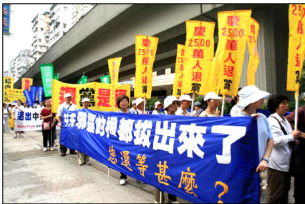
游行民众声援二千五百万人退出中共

【明慧网】零七年八月二十六日，香港退党服务中心等多个民间团体机构举办以“替天行道 解体中共”为主题的声援二千五百万勇士退出中共集会游行，呼吁中国大陆各界通过退党退团退队来和平解体中共。出席集会的演讲者指出，退党的发展令人鼓舞，相信中共解体在即。香港退党服务中心义工在集会上发言证实，越来越多的中国大陆游客在香港的旅游景点宣告三退。随着三退总数突破二千五百万，中国人民进一步觉醒，中共解体在即，中国社会面临着一场前所未有的深刻变革。