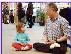
图：善良无罪，修炼无罪。

就说近的吧。单位搞改革，千方百计降成本，首先是人工成本，成天讲定岗定员，可是现在干部和工人的比例都1:3了，还在缩小，把提拔干部的权力下放后，不需要以前那种层层审批了，想提拔谁就提拔谁，有的地方不缺硬塞。现在等级差别明显，反正提起来就有待遇，以至拉关系，走门子，说情的，溜须拍马的，投机钻营蔚然成风，可是