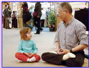
图：善良无罪，修炼无罪。

就说近的吧。单位搞改革，千方百计降成本，首先是人工成本，成天讲定岗定员，可是现在干部和工人的比例都1:3了，还在缩小，把提拔干部的权力下放后，不需要以前那种层层审批了，想提拔谁就提拔谁，有的地方不缺硬塞。现在等级差别明显，反正提起来就有待遇，以至拉关系，走门子，说情的，溜须拍马的，投机钻营蔚然成风，可是