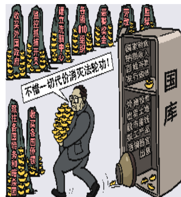
中共江罗集团倾国之力 迫害法轮功，制造了巨大 的财政黑洞