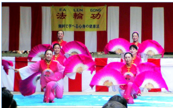
▲ 法轮功学员表演的中国民族舞蹈扇子舞