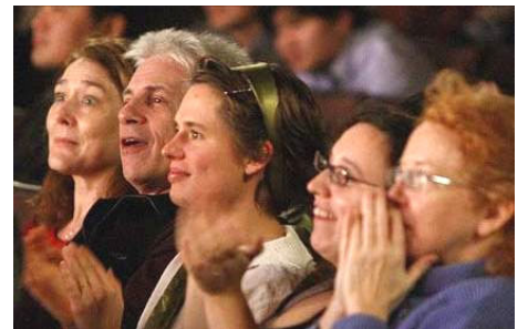
▲ 观众被晚会展现的内涵深深吸引

他说：“新唐人电视台主办的神韵晚会开辟了一个新的时代，向世界展现了完全没有党文化的中华文化。这正是人们所需要的。”◇