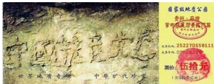
贵州平塘掌布乡，奇石藏字现真相。 世人有目共睹：“中国共产党亡”。

怎么办？神的慈悲给了中国人清洗、解除当初毒誓的机会——声明退出邪党一切组织。当天惩开始时，就没有机会了。请珍惜现在的机缘。