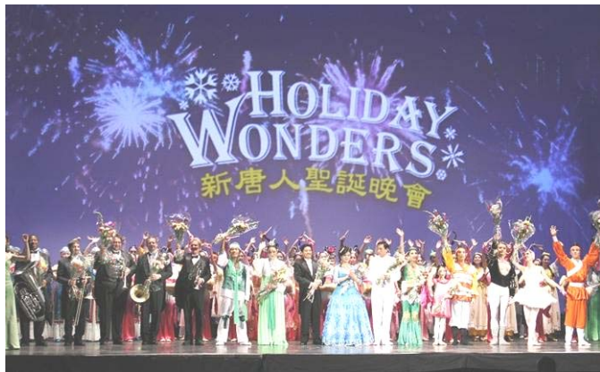
新唐人圣诞晚会 18 日首演于纽约百老汇碧肯剧院，演出反响热烈，演员谢幕。

【明慧网】二零零七年十二月十八日晚七点半，新唐人圣诞晚会在纽约百老汇碧肯剧场拉开大幕。这台溶合东西方经典文化艺术的国际一流演出，意境深远的构思，美妙轻盈的中国古典舞，纯净华美的音乐，响彻云霄的歌声，壮观生动的天幕，都在演绎着纯真、纯善、纯美的神传文化，释放着无限慈悲的能量，震撼着每一个人的心灵。演出结束后，好评如潮。