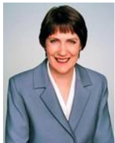
新西兰总理克拉克

在人权圣火到达新西兰之际，新西兰总理海伦·克拉克委托私人秘书散德拉·泰姆比亚于二零零七年十二月十三日回信给法轮功受迫害真相联合调查团，表达了对人权圣火传递活动的良好祝愿。即将在全国传递的人权圣火活动，在新西兰主流社会及不同种族社区间早已引起很大反响，很多社会名流及社团代表都将亲自参加活动以示支持，媒体对此也