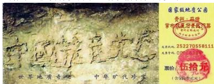
贵州平塘掌布乡，奇石藏字现真相。 世人有目共睹：“中国共产党亡”。

怎么办？神的慈悲给了中国人清洗、解除当初毒誓的机会——声明退出邪党一切组织。当天惩开始时，就没有机会了。请珍惜现在的机缘。