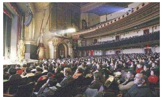
观众聚精会神的观看演出

纽约联邦议员, 纽约州参议员, 纽约州众议员, 和纽约市议员, 共 14 位政要纷纷给新唐人电视台和神韵艺术团发来褒奖和贺信。