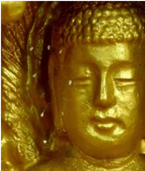
韩国须弥山禅院的佛像脸上长出的优昙婆罗花。

1997 年，韩国媒体首次报导了清溪寺出现优昙婆罗花，后来韩国媒体又相继报导了许多地方有奇花开放，引起佛教界的惊喜。接着在大陆各地陆续传出了优昙婆罗花开放的消息，