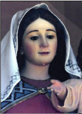
流泪的圣母像， 澳大利亚

的文明古迹，这些古迹都是几十万年前、几百万年前、几千万年前甚至上亿年前留下来的。这说明地球上曾出现过许多次文明。研究表明：每一次人类文明走向败落的时候，就会有大灾难降临世间，将败坏的文明和世人淘汰掉。我们本次人类走过了一段漫长的历程，现在已进入了本次文明的