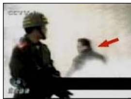
3、手摸被打后的头部 4、击打者仍保持用力姿势