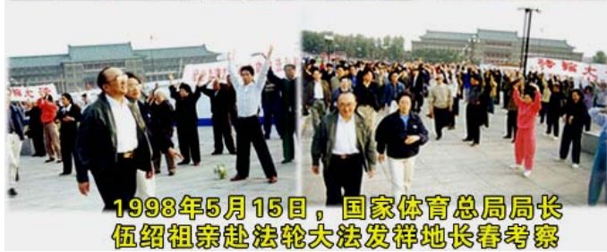
1998年5月15日，国家体育总局局长伍绍祖亲赴法轮大法发祥地长春考察

1998年5月15日，国家体育总局局长伍绍祖亲赴法轮大法发祥地长春考察。98年9月国家体总抽样调查法轮功修炼人12553人，疾病痊愈和基本康复率为77.5%，加上好转者人数20.4%，祛病健身总数有效率达97.9%。平均每人每年节约医药费1700多元，每年共节约医药费2100多万元。