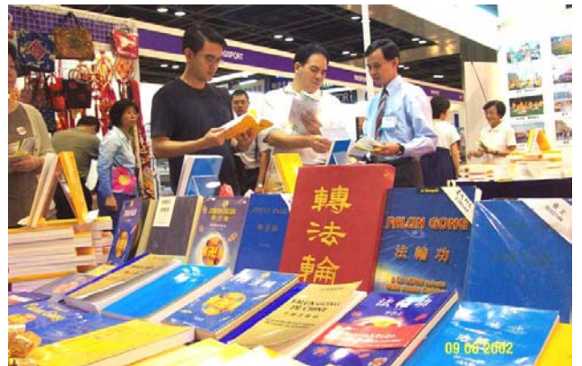
新加坡世界书展中的各语种法轮功书籍。 (2002 年 6 月)

1995 年 3 月和 5 月,李洪志老师应邀到法国和瑞典传功讲法,拉开了法轮大法在海外洪传的序幕。至今,法轮功已洪传世界 80 多个国家和地区。仅台