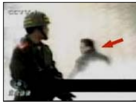
3、手摸被打后的头部 4、击打者仍保持用力姿势