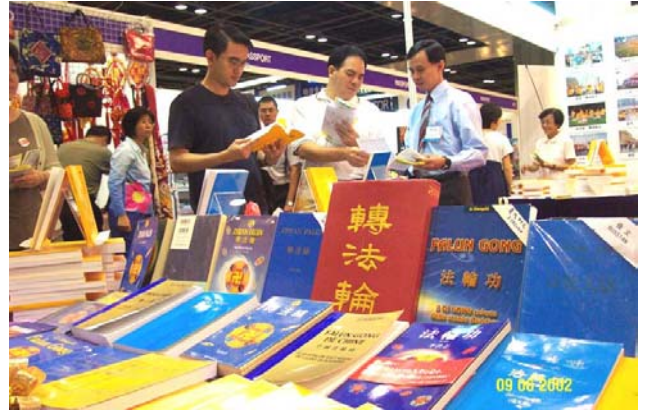
新加坡世界书展中的各语种法轮功书籍。 (2002 年 6 月)

1995 年 3 月和 5 月,李洪志老师应邀到法国和瑞典传功讲法,拉开了法轮大法在海外洪传的序幕。至今,法轮功已洪传世界 80 多个国家和地区。仅台