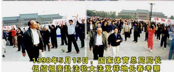
1998年5月15日，国家体育总局局长伍绍祖亲赴法轮大法发祥地长春考察

1998年5月15日，国家体育总局局长伍绍祖亲赴法轮大法发祥地长春考察。98年9月国家体总抽样调查法轮功修炼人12553人，疾病痊愈和基本康复率为77.5%，加上好转者人数20.4%，祛病健身总数有效率达97.9%。平均每人每年节约医药费1700多元，每年共节约医药费2100多万元。