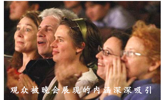
观众被晚会展现的内涵深深吸引

目前神韵艺术团已开始在全球近70个城市巡回上演中国新年晚会，全新的节目必将引发更大轰动。◇