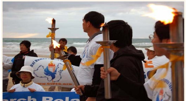
图：人权圣火在新西兰吉斯本迎来新年曙光

人权圣火活动在新西兰主流社会引起很大反响，主要的电视报纸都给与报道，很多社会名流及社团代表都将亲自参加活动，表示强烈反对中共活体摘取法轮学员器官的残忍暴行。人权圣火在经过新西兰十三个主要城市后，还将在美洲大陆继续传递。