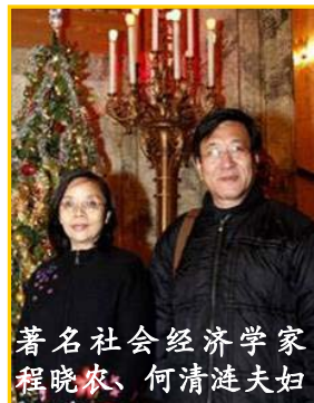
著名社会经济学家 程晓农、何清涟夫妇

【明慧网】普林斯顿大学《当代中国研究》杂志主编程晓农，十二月十九日观看了神韵艺术团主演的“新唐人晚会”之后表示：中共对法轮功的迫害完全是一场毫无正当理由和法律依据的政治大迫害，是对全体中国人民的迫害，法轮功学员反迫害是在救世人。