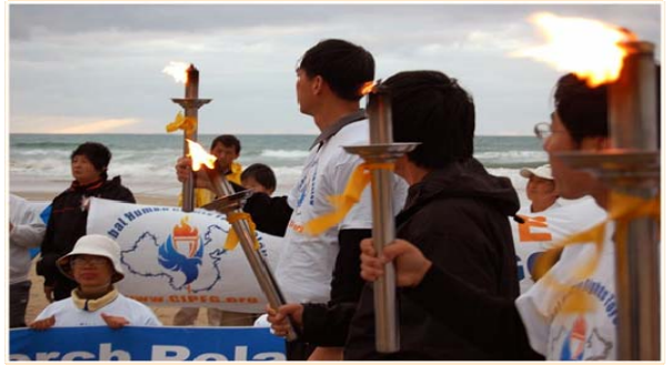
图：人权圣火在新西兰吉斯本迎来新年曙光

人权圣火活动在新西兰主流社会引起很大反响，主要的电视报纸都给与报道，很多社会名流及社团代表都将亲自参加活动，表示强烈反对中共活体摘取法轮学员器官的残忍暴行。人权圣火在经过新西兰十三个主要城市后，还将在美洲大陆继续传递。