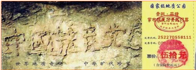
▲掌布风景区门票上“中国共产党亡”的照片

在贵州平塘县掌布风景区发现了一块二亿七千万年前的藏字石，这块石头自高崖坠地后，一分为二。二零零二年六月被当地村民发现藏字，藏字可辨有六个大字“中国共产党亡”，这是国内一百多家媒体包括新华社、中央台等，都有过报导和专题，网上也能搜索到相关照片。当然，他们都不敢报最