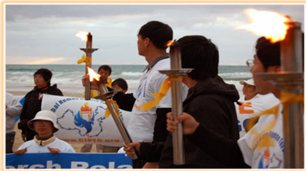
图：人权圣火在新西兰吉斯本迎来新年曙光