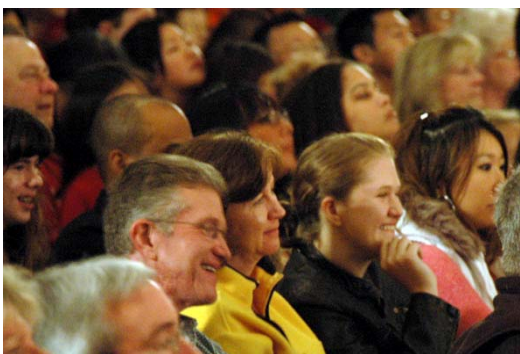
神韵晚会令观众陶醉其中

国际移民基金会主席爱德华先生说，这台晚会是一次真正完美的中国文化之旅，感受到真诚、善良、美好、积极、向上的心境，因此生出对中国传统文化的敬仰。