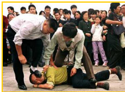
天安门便衣警察毒打上访、说明真相的法轮功学员

“蚁力神”事件爆发至今，中共的所有官方媒体严密封锁信息。这和“蚁力神”骗局破产前，中央电视台、辽宁省卫视等各大媒体的吹捧、造势形成了鲜明对比。事发后，中共不保护百姓利益，而保护行骗者；政府不去关心百万养殖户，而是把他们当成“危险分子”去监视。这场由官方制造的特大诈骗案，使数百万民众失去财产，一些民众被逼的走投无路，甚至失去生命。