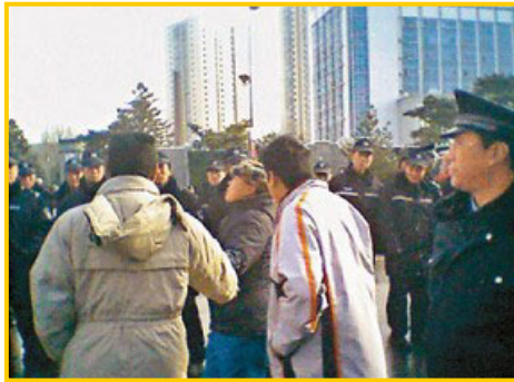
警察对上访的“蚁民”施行暴力

二零零七年十一月二十日，辽宁省沈阳市爆发了大规模的群体性抗议事件。三万多人来到省政府，呼吁严惩非法集资的“蚁力神”集团。据有关部门初步统计，“蚁力神”集团至少骗取了一百二十多万蚂蚁委托养殖户的四百多亿资金，范围以辽宁为中心，辐射吉林、黑龙江、内蒙等地。