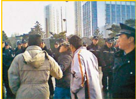
警察对上访的“蚁民”施行暴力

二零零七年十一月二十日，辽宁省沈阳市爆发了大规模的群体性抗议事件。三万多人来到省政府，呼吁严惩非法集资的“蚁力神”集团。据有关部门初步统计，“蚁力神”集团至少骗取了一百二十多万蚂蚁委托养殖户的四百多亿资金，范围以辽宁为中心，辐射吉林、黑龙江、内蒙等地。