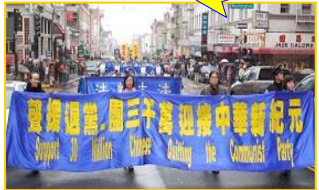
加拿大民众游行声援三千万人退出党团队