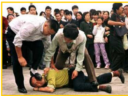
天安门便衣警察毒打上访、说明真相的法轮功学员

“蚁力神”事件爆发至今，中共的所有官方媒体严密封锁信息。这和“蚁力神”骗局破产前，中央电视台、辽宁省卫视等各大媒体的吹捧、造势形成了鲜明对比。事发后，中共不保护百姓利益，而保护行骗者；政府不去关心百万养殖户，而是把他们当成“危险分子”去监视。这场由官方制造的特大诈骗案，使数百万民众失去财产，一些民众被逼的走投无路，甚至失去生命。