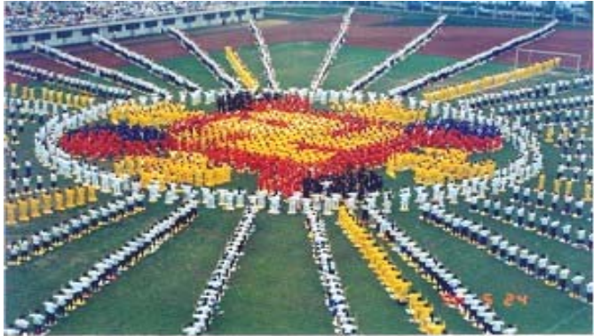
1996 年 5 月湖北武汉法轮功学员集体组图炼功

亿人修炼。法轮功学员在修炼后不但达到身心健康，而且普遍道德升华。 国家体育总局于 1998 年派出调研组到长春和哈尔滨对法轮功进行调研，对法轮功作出了正面的评价，认为法轮功的功法功效很好，对于社会的稳定，对于精神文明建设效果显著。 1998 年 9 月由医学专家组成的小组，对广东 12,553 名法轮功学员进行表格抽样调查，结果表明祛病健身总有效率为 97.9%。 超越民族及国界 法轮功洪传超过 80 多国 在过去的 15 年间，法轮功已传遍了亚洲、欧洲、美洲、大洋洲、非洲等 80 多个国家和地区。美国、 5