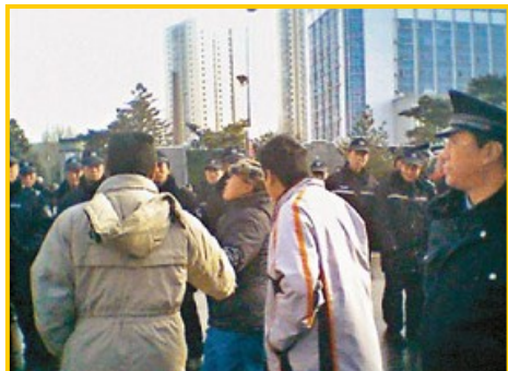
警察对上访的“蚁民”施行暴力

二零零七年十一月二十日，辽宁省沈阳市爆发了大规模的群体性抗议事件。三万多人来到省政府，呼吁严惩非法集资的“蚁力神”集团。据有关部门初步统计，“蚁力神”集团至少骗取了一百二十多万蚂蚁委托养殖户的四百多亿资金，范围以辽宁为中心，辐射吉林、黑龙江、内蒙等地。