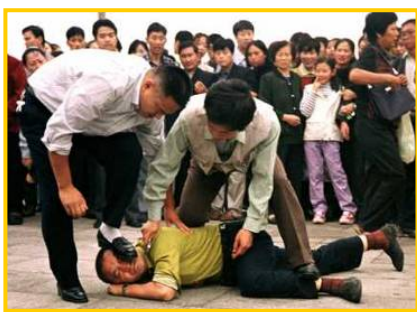
天安门便衣警察毒打上访、说明真相的法轮功学员

“蚁力神”事件爆发至今，中共的所有官方媒体严密封锁信息。这和“蚁力神”骗局破产前，中央电视台、辽宁省卫视等各大媒体的吹捧、造势形成了鲜明对比。事发后，中共不保护百姓利益，而保护行骗者；政府不去关心百万养殖户，而是把他们当成“危险分子”去监视。这场由官方制造的特大诈骗案，使数百万民众失去财产，一些民众被逼的走投无路，甚至失去生命。