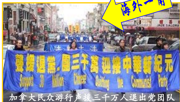
加拿大民众游行声援三千万人退出党团队