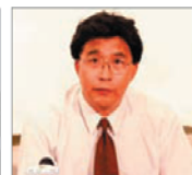
前沈阳市司法局 局长 韩广生