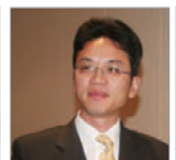
前驻悉尼外交官 陈用林