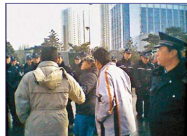
当局出动两万多名警察，围堵驱赶上访的蚂蚁养殖户。

政府的答复激起了养殖户的愤怒和不满。众所周知，八年多来，中共是怎样迫害法轮功学员的：用谎言加暴力，一边封锁真相，一边用中共媒体大肆造谣，煽动仇恨，为迫害铺路。随后而来的各种酷刑手段，至少使三千多位法轮功学员失去生命。难道中共政府也要这样对待这些被骗的养殖户吗？