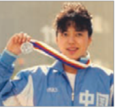
前奥运游泳选手 黄晓敏