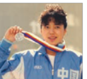
前奥运游泳选手 黄晓敏