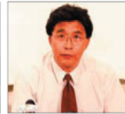
前沈阳市司法局 局长 韩广生