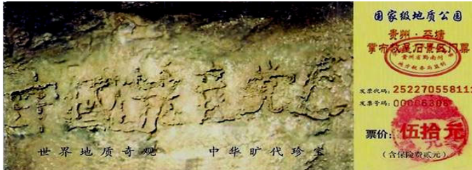
贵州省平塘县掌布乡风景区门票

明慧网二零零六年九月十三日消息，二〇〇三年六月，在贵州省平塘县境内掌布乡发现一巨石，石壁上凸显一排字迹，可清晰的辨识有六个大字：