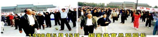
1998年5月15日，国家体育总局局长伍绍祖亲赴法轮大法发祥地长春考察

◆一九九八年下半年，以乔石为首的部分全国人大离退休老干部，对法轮功进行了详细调查、研究，得出“法轮功于国于民有百利而无一害”的结论，并于年底向江泽民为首的政治局提交了调查报告。这也是在职及离休的中共二百名以上高级干部几次致中共中央联名信反复申说的话。中央政治局七个常委中的六个都反对镇压法轮功。