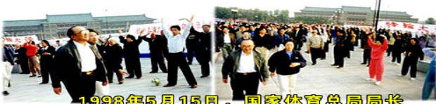
1998年5月15日，国家体育总局局长伍绍祖亲赴法轮大法发祥地长春考察

◆一九九八年下半年，以乔石为首的部分全国人大离退休老干部，对法轮功进行了详细调查、研究，得出“法轮功于国于民有百利而无一害”的结论，并于年底向江泽民为首的政治局提交了调查报告。这也是在职及离休的中共二百名以上高级干部几次致中共中央联名信反复申说的话。中央政治局七个常委中的六个都反对镇压法轮功。