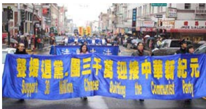
旧金山游行集会，庆三千万退党，退党游行经过中国城