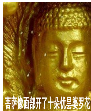
菩萨像面部开了十朵优昙婆罗花

其中《圣经启示录》讲述了在末世会有大灾难和邪恶的兽为祸人间及神将再临人间救度人类。据佛经记载，三千年一开的优昙婆罗花在人间开放时，预示着转轮圣王在世间传法度人。