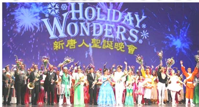
2007年由神韵艺术团担纲的新唐人圣诞晚会，