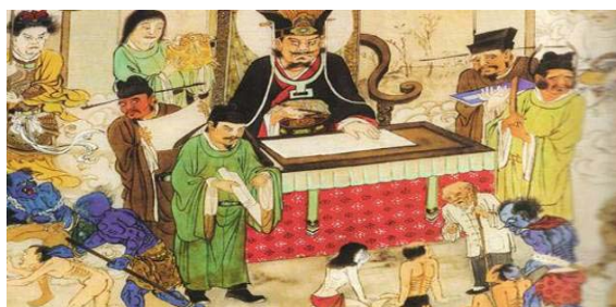
阎王断案不徇私情

由此想到那些被中共“无神论”教育出来的不相信善恶报应的人，真该猛醒了。这就是为什么“天要灭中共”：中共不仅残害死了八千多万中国人，还让十几亿中国人不信神、不信天理报应、为了私欲不惜干伤天害理的事，导致中国社会道德下滑到如此地步。这样一个与神对着干的邪党，上天能留它吗？那么，哪个人要是坚持与它为伍、做它的一员，上天还会留这个人吗？