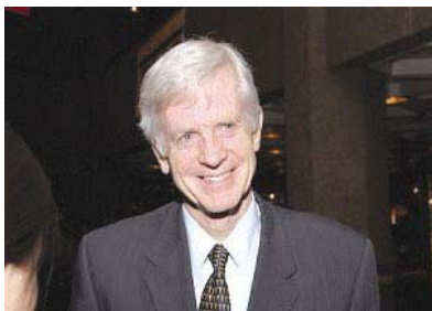
资深国会议员、前亚太司司长大卫·乔高

资深国会议员、前亚太司司长大卫·乔高十四日接受采访时希望所有人都能看到演出。他说，“晚会令人升华、给人启迪、美的让人目眩。我们今晚看到的都很神奇，我剩下的只有对制作这场演出的人们深深的敬意。”乔高认为晚会表现的“才是真实的中国”。乔高说，“这场演出展现了精彩的文化和传统，是正宗的中华文化。”