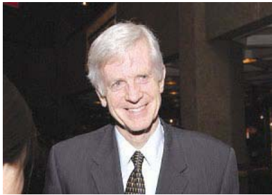
资深国会议员、前亚太司司长大卫·乔高

资深国会议员、前亚太司司长大卫·乔高十四日接受采访时希望所有人都能看到演出。他说，“晚会令人升华、给人启迪、美的让人目眩。我们今晚看到的都很神奇，我剩下的只有对制作这场演出的人们深深的敬意。”乔高认为晚会表现的“才是真实的中国”。乔高说，“这场演出展现了精彩的文化和传统，是正宗的中华文化。”