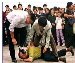
天安门便衣警察毒打上访、说明真相的法轮功学员