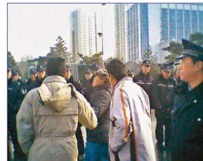
当局出动两万多名警察，围堵驱赶上访的蚂蚁养殖户。