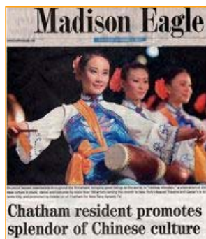
▲新泽西媒体 Madison Eagle 报导圣诞晚会

融合东西方经典文化艺术的国际一流演出“新唐人圣诞奇观晚会”，十二月十八日首演于纽约百老汇碧肯剧院，观众佳评如潮。