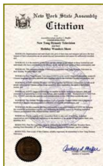
▲纽约州议会嘉奖新唐人圣诞晚会