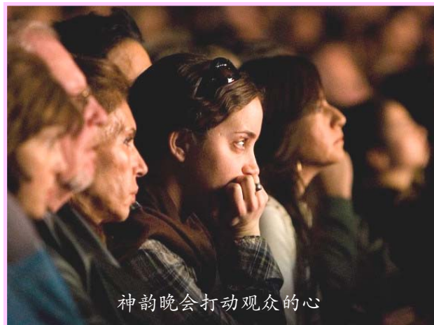
神韵晚会打动观众的心