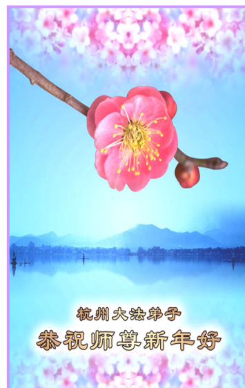
上图：大陆大法弟子给师尊的贺卡

云霏雾縠终须散 江海长帆已见岸 北风声短 雪梅含笑 又是一年春将到 西望蓬山路迢迢 寄语青鸟 师尊师尊，新年好◇