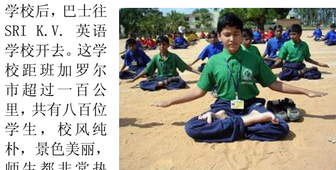
SRI K.V. 英语学校的学生 学炼第五套功法——神通加持法

离开 Sri Adichunchanagiri Mahasamsthama moth