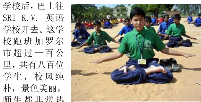
SRI K.V. 英语学校的学生 学炼第五套功法——神通加持法

离开 Sri Adichunchanagiri Mahasamsthama moth