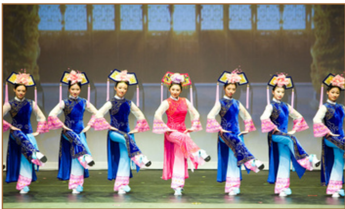
舞蹈: 八 大清仕女

“神韵”晚会的演员们大多数是旅居海外修炼法轮功的华人艺术家组成。整场晚会展现了华夏五千年的璀璨文明和古老神话传说。晚会向人们传递着真诚、善良与光明,同时呼吁全球正义人士共同抵制中共对法轮功的残酷迫害。