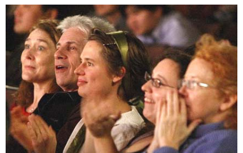
▲观众被晚会展现的内涵深深吸引

他说：“新唐人电视台主办的神韵晚会开辟了一个新的时代，向世界展现了完全没有党文化的中华文化。这正是人们所需要的。”