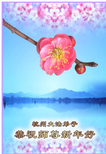
上图：大陆大法弟子给师尊的贺卡