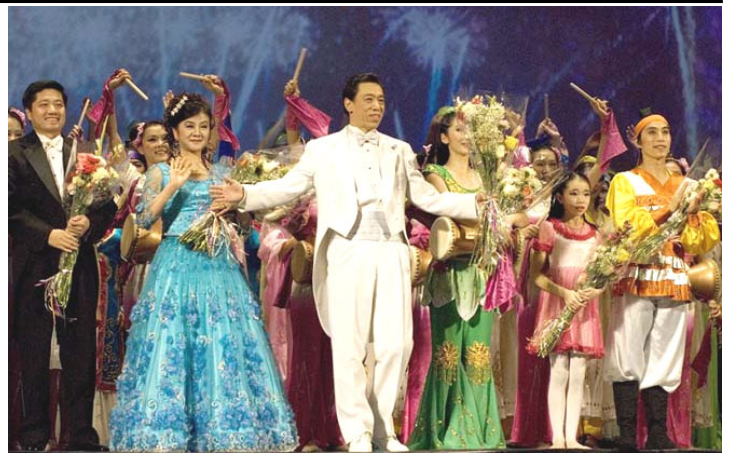
▲神韵演员谢幕。左起：著名歌唱家洪鸣、白雪、关贵敏，世界中国舞大赛青年女冠军任凤舞，右一为男冠军陈永佳。