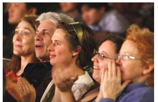
▲观众被晚会展现的内涵深深吸引

他说：“新唐人电视台主办的神韵晚会开辟了一个新的时代，向世界展现了完全没有党文化的中华文化。这正是人们所需要的。”◇