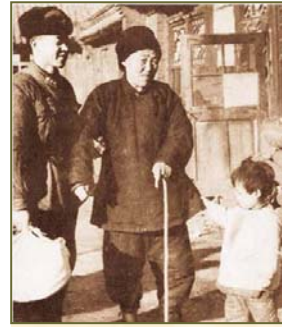
图：扶老携幼，还有随身摄影师抓拍精彩瞬间，真是“好人”有“好事”啊。

这些记者专门到抚顺雷锋纪念馆采访，他们指着雷锋给伤病员送苹果，雨夜送大娘的照片说：雷锋做好事是自发的还是被迫的，为什么雷锋做好事不留名还留下了照片，这是不是经过“导演”的？一个普通战士，短短的一生竟然留下了大约 384 张照片，很多是被抓拍到的做好人好事的照片。在当时照相还是奢侈品的年代，怎么可能呢？