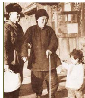
图：扶老携幼，还有随身摄影师抓拍精彩瞬间，真是“好人”有“好事”啊。

“如果你是一滴水，你是否滋润了一寸土地？如果你是一线阳光，你是否照亮了一分黑暗？”，这是散文吗？不是。“人的生命是有限的，可是，为人民服务是无限的，我要把有限的生命，投入到无限的为人民服务之中去。”这是哲学家的灵感吗？也不是。这些都出自只有高小文化背景，却有着教授水平的“雷锋日记”。