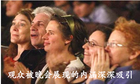
观众被晚会展现的内涵深深吸引

观看晚会的多族裔观众带着对中国文化的好奇心而来，惊喜地从这台洋洋中土文化大观中发现自己民族的文化片影，他们说，这些奇妙的共性令他们更加喜欢这台晚会，帮助他们理解中华历史文化。