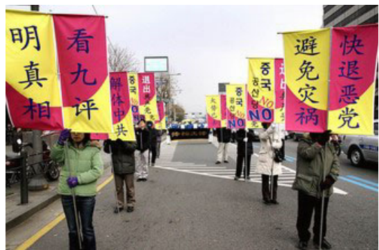
韩国首尔庆祝三千万大陆人士退出中共大游行