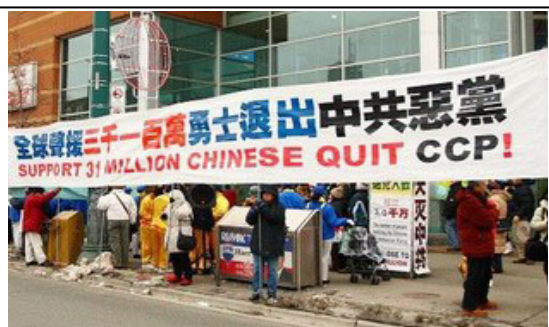
加拿大渥太华、多伦多、温哥华、蒙特利尔和爱德蒙顿五座城市联手举行声援活动。