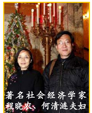
著名社会经济学家程晓农、何清涟夫妇

【明慧网】普林斯顿大学《当代中国研究》杂志主编程晓农，十二月十九日观看了神韵艺术团主演的“新唐人晚会”之后表示：中共对法轮功的迫害完全是一场毫无正当理由和法律依据的政治大迫害，是对全体中国人民的迫害，法轮功学员反迫害是在救世人。