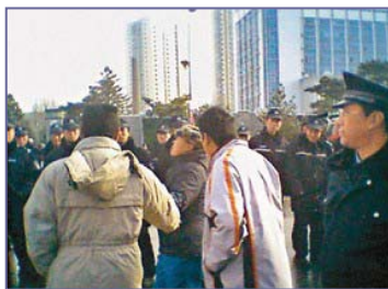
当局出动两万多名警察，围堵驱赶上访的蚂蚁养殖户。

二零零七年十一月二十日，辽宁省沈阳市爆发了大规模的群体性抗议事件。三万多人来到省政府，呼吁严惩非法集资的“蚁力神”集团。据有关部门初步统计，“蚁力神”集团至少骗取了一百二十多万蚂蚁委托养殖户的二百多亿资金，范围以辽宁为中心，辐射吉林、黑龙江、内蒙等地。