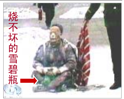
▲中共媒体的作用：欺骗百姓、为镇压制造借口。假恶斗的中共恐惧“真善忍”，又找不到法轮功的不是，于是导演自焚等丑剧，妄图使迫害“合理化”。

如果看过在大陆广为流传的奇书《九评共产党》，就会知晓，之所以会发生蚁力神的这样的事件，中共恶党是一切罪恶的根源。