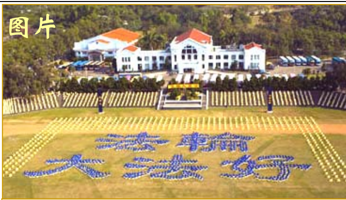
▲零七年十二月一日，约四千名台湾法轮功学员在台湾南投县中兴新村，排字“法轮大法好”。