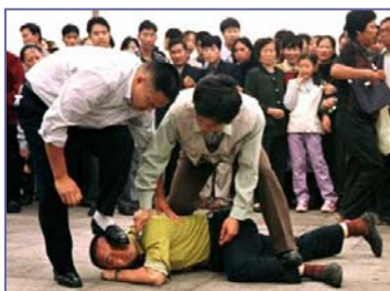
天安门便衣警察毒打上访、说明真相的法轮功学员