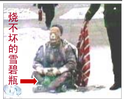
▲中共媒体的作用：欺骗百姓、为镇压制造借口。假恶斗的中共恐惧“真善忍”，又找不到法轮功的不是，于是导演自焚等丑剧，妄图使迫害“合理化”。

如果看过在大陆广为流传的奇书《九评共产党》，就会知晓，之所以会发生蚁力神的这样的事件，中共恶党是一切罪恶的根源。