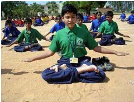
SRI K. V. 英语学校的学生 学炼第五套功法——神通加持

这是一所宗教学校，从小学、中学、高中、大学一连贯，学生共计超过二千人。在长老亲自陪同下，校长特助用麦克风的发出口令，各班级老师带着学生，分成两批，列队学炼法轮功。