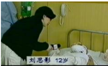
气管切开后还能说话、唱歌？ 记者采访不穿防护服不戴口罩

这就是为什么？——因为“自焚”是假的，是拍电影嫁祸法轮功，就是为了让咱老百姓上当！