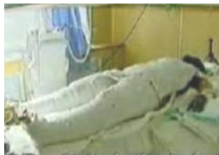
《焦点访谈》中的“自焚者”被包裹得严密