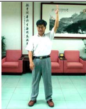
洪校长在练习法轮功

宜兰县内的宜兰大学、佛光大学、国立罗东高工、国立宜兰高商等学校都成立了法轮功社团，教师学生学炼法轮功呈现蓬勃发展的情况。近年来，洪校长也多次参与宜兰县“法轮大法教师研习营”的活动，积极热心的弘扬法轮功，希望更多的教师能分享法轮功带来的美好。◇