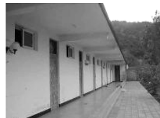
非法关押法轮功学员的北京慈善寺敬老院