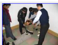
九台饮马河劳教所酷刑：电棍插裤裆电击阴部