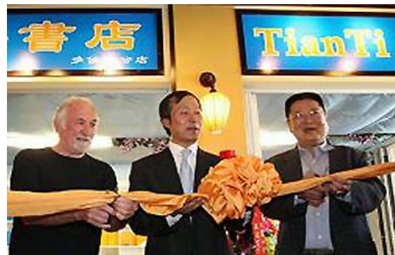
多伦多中区唐人街的“天梯书店”开张

1999年7月20日，中共大量收缴、销毁《转法轮》，《转法轮》成为大陆“第一禁书”。