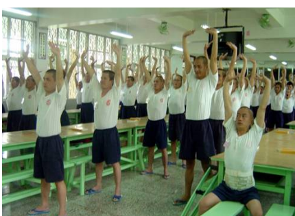
台湾多家监狱把学炼法轮功纳入教化课程。图为服刑人在炼功。

太太和我同时开始炼法轮功她也凡事努力做到先考虑别人，付出不计回报，所以与儿媳相处的很融洽。她原本很少出门，现在常到监狱教功。她说：“每个