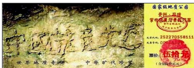
图为藏字石风景区门票：“中国共产党亡”清晰可见

二零零二年六月“藏字石”在贵州省平塘县浪马寨被发现，巨石上清晰可见“中国共产党亡”六个横排大字。据专家考证“藏字石”形成于两亿多年前，绝无任何人工雕琢、塑造、粘贴的痕迹。“藏字石”上的“中国共产党亡”，正是上天对人明示中共必将灭亡。