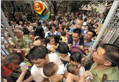
在四川成都一家医院门前挤满了带孩子的家长。

我们百姓现在最关心的就是如何彻查毒食品的问题。但想想看，像三鹿这样的毒奶粉可以连续15年销量居全国第一，而且是国家“免检产品”。就在2007年，有关当局还将中国乳品界唯一的“国家科技进步奖”授予了三鹿集团。而现在中共撤换了几个地方官员就能让毒食品残害生命的惨剧不再发生吗？依靠中共政府能够彻底解决食品安全问题吗？看看质检总局公布的数据：还有22家乳制品企业的69批次产品都验出含有三聚氰胺。可见