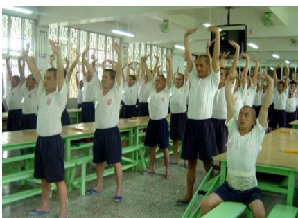
台湾多家监狱把学炼法轮功纳入教化课程。图为服刑人在炼功。

太太和我同时开始炼法轮功她也凡事努力做到先考虑别人，付出不计回报，所以与儿媳相处的很融洽。她原本很少出门，现在常到监狱教功。她说：“每个人