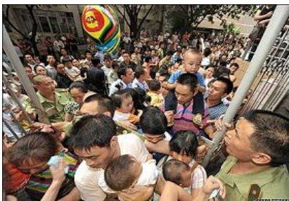
在四川成都一家医院门前挤满了带孩子的家长。

我们百姓现在最关心的就是如何彻查毒食品的问题。但想想看，像三鹿这样的毒奶粉可以连续15年销量居全国第一，而且是国家“免检产品”。就在2007年，有关当局还将中国乳品界唯一的“国家科技进步奖”授予了三鹿集团。而现在中共撤换了几个地方官员就能让毒食品残害生命的惨剧不再发生吗？依靠中共政府能够彻底解决食品安全问题吗？看看质检总局公布的数据：还有22家乳制品企业的69批次产品都验出含有三聚氰胺。可见