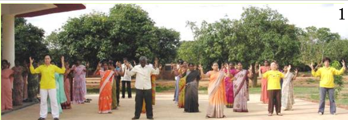
图 1、2/印度学校 Byreshawara 全校师生在体育课上练习法轮功。