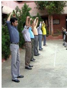
学校老师在队伍前排示范

据了解，离邦加罗尔不远的一个镇，一所学校的校长之前是天主教的牧师兼校长，在亲自体验法轮功的心灵震撼后，他将心得转知学校老师学生。师生短时间的体验后，发觉身体比以前好很多，神奇的是昔日调皮学生变的听话且上课专心，经统计，学生功课普遍进步。对于医疗资源普遍缺乏的印度社会，完全免费的法轮功对他们无疑是天赐的礼物。