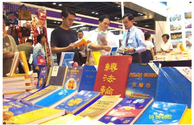
新加坡世界书展中的各语种法轮功书籍。 (2002年6月)

1995年3月和5月，李洪志老师应邀到法国和瑞典传功讲法，拉开了法轮大法在海外洪传的序幕。至今，法轮功已洪传世界80多个国家和地区。仅台湾一地，修炼人数就由最初的数千人，增加至现在的超过60万人。