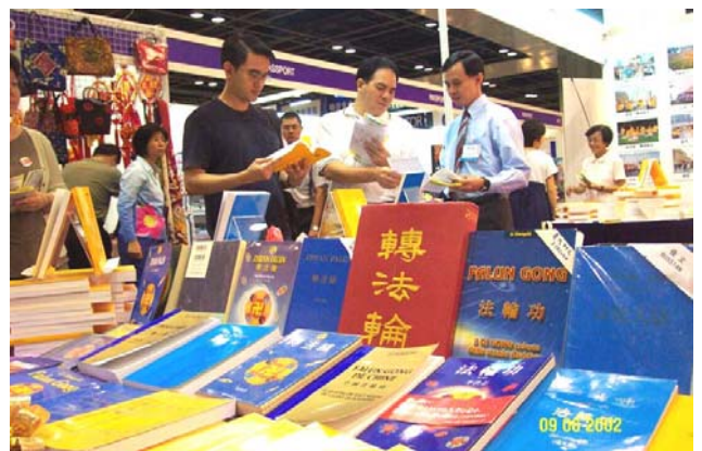
新加坡世界书展中的各语种法轮功书籍。 (2002年6月)

1995年3月和5月，李洪志老师应邀到法国和瑞典传功讲法，拉开了法轮大法在海外洪传的序幕。至今，法轮功已洪传世界80多个国家和地区。仅台湾一地，修炼人数就由最初的数千人，增加至现在的超过60万人。