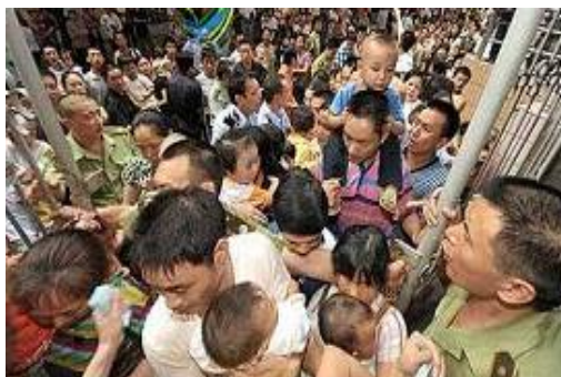
四川成都一家医院门前挤满了带孩子的家长