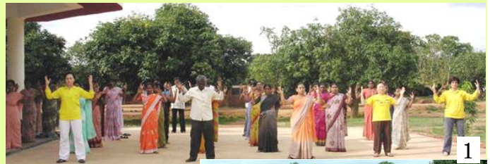
图1、2/印度学校 Byreshawara 全校师生在体育课上练习法轮功。