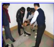
九台饮马河劳教所酷刑：电棍插裤裆电击阴部