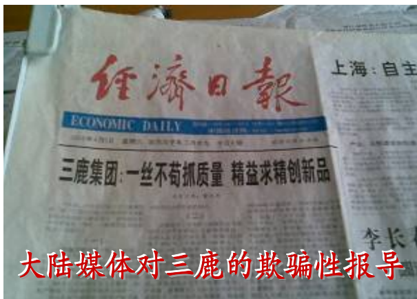
大陆媒体对三鹿的欺骗性报导