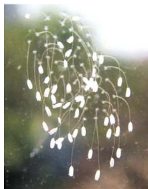
青岛某公司玻璃上开出的优昙婆罗花

10 月 4 日新华网罕见的转载了《青岛日报》的一篇报道，题目是《窗户玻璃长出“花”》。文中说，10 月 3 日上午，青岛早报记者来到城阳大北曲西村的一家企业，在公司二楼办公室东侧的玻璃上看到了这些白色小花。雪白的花朵直径约有 1 毫米，花形如钟，淡白色，花茎细如金丝，共有 47 朵。仔细看，47 朵小花的花径与玻璃直接连在一起，既没有扎根泥土，玻璃下面也没有裂痕。 公司员工说，刚开始发现这些小花时，不知道是什么东西，还以为玻璃不干净，差点用抹布擦掉。公司一名经理看过后说，这可能是传说中的『优昙婆罗花』。该记者在网上搜索发现，很多地方也出现过类似的花。这家公司玻璃上的小白花，与网上流传的“优昙婆罗花”图片比较，在形态、颜色等方面都非常相似。